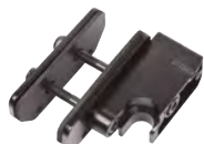
SH 77 – Halter als Zubehör erhältlich