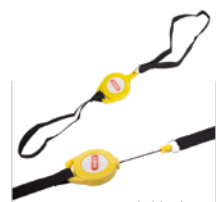
inklusive Memory Roll Up Cable