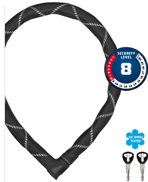
Steel-O-Flex Iven 8200