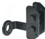
SH 68 – Halter als Zubehör erhältlich