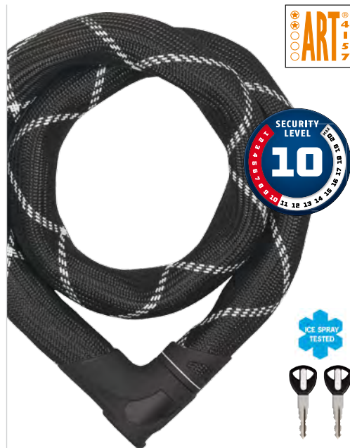
Catena Iven 8210

verfügbare Längen 110 cm, 140 cm, 170 cm