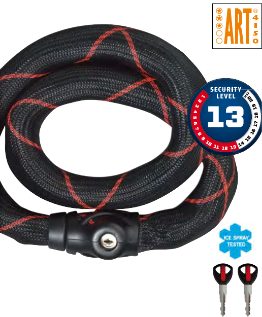
Catena Ivy 9100