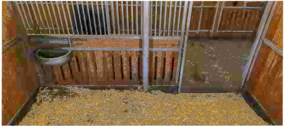
Ein Blick auf das Boxeninnere ist über die Kamer jederzeit von überall aus möglich.

Der Zugriff auf die Kameras ist dank App für alle berechtigten Nutzer bequem und mobil möglich.