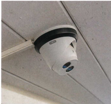
30 Kameras ermöglichen auf der Reitanlage Aubenhausen eine Überwachung rund um die Uhr.

Berücksichtigung aller Herausforderungen wie z. B. Lichtverhältnisse (Nachtsichtsystem), klimatische Bedingungen oder Umgebungseinflüsse (z. B. Staub, Ammoniak).